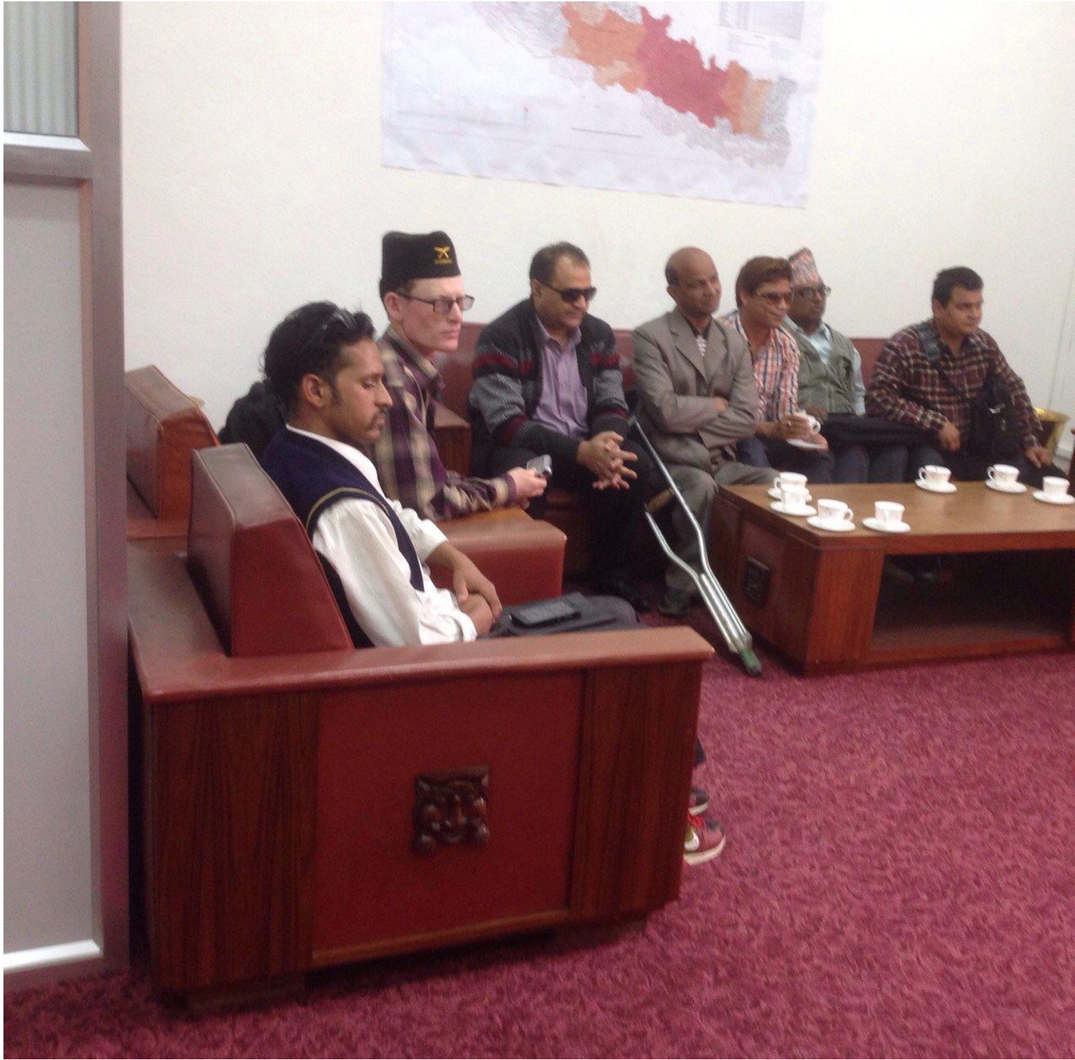
Delegation meeting the Secretary of National Reconstruction Authority